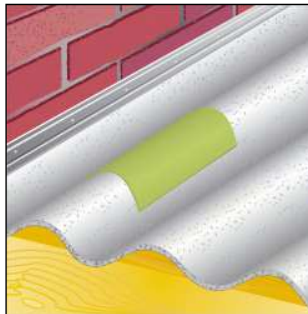
Für Verklebung auf Faserzementwellplatten