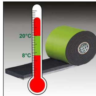
Bild 5: Lagerung und Verarbeitung von TP652 zwischen 8°C und 20°C. Hohe Temperaturen beschleunigen das Aufgehverhalten, tiefe verzögern es.