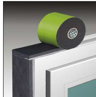
Bild 3: TP652 auf den Rahmen kleben - Seite mit der grauen Stufe nach Innen. An den Ecken überstehen lassen.