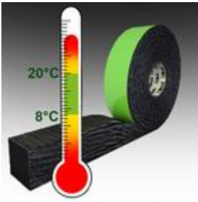
Bild 5: Lagerung und Verarbeitung von TP653 zwischen 8°C - 20°C. Hohe Temperaturen beschleunigen das Aufgehverhalten, tiefe verzögern es (siehe Vorbereitung).